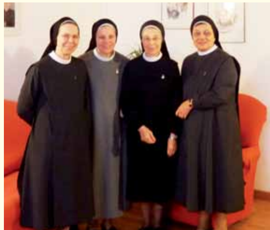
Communauté de Sevegliano (UD)