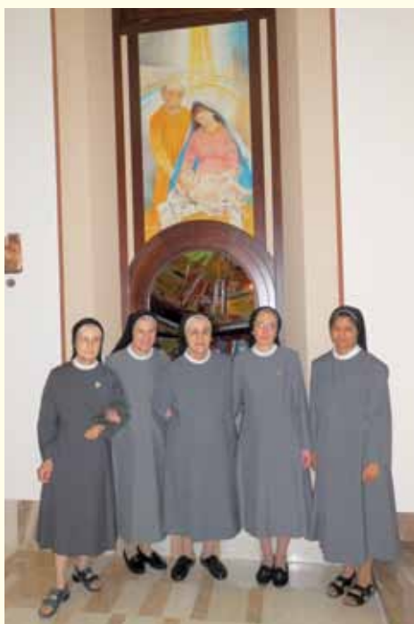
Pensionnat communautaire "Sacré-Cœur" à Udine