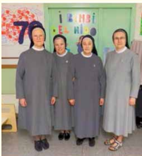
Communauté Savorgnano (UD)

Les sœurs de la communauté de Paluzza (UD) en prière