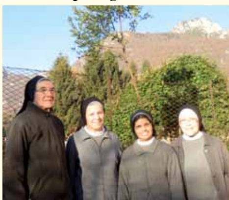
Communauté d'Ampezzo (UD)

L'expérience de se sentir confirmées par ses propres supérieures, même aussi au dedans de ses moments critiques, est à considérer une grande grâce à garder, et pour laquelle remercier Dieu.