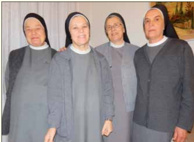
Communauté de Rauscedo