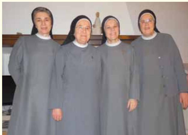
Communauté de Arzene (PN)