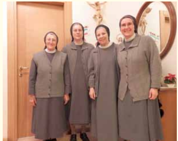
Communauté de Paese (TV)