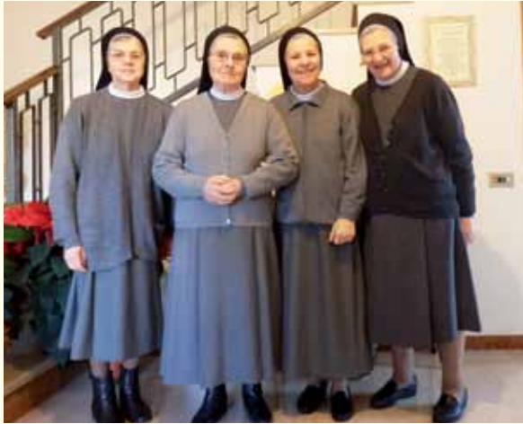
Communauté de Postioma (TV)