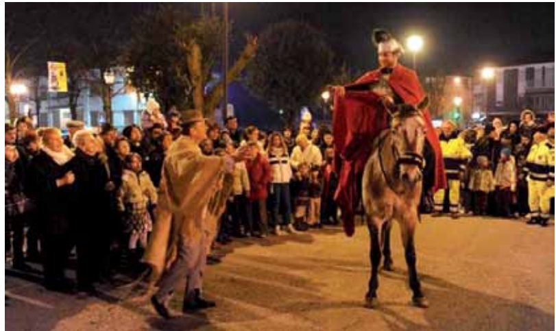
Saint-Martin donnant son manteau aux pauvres