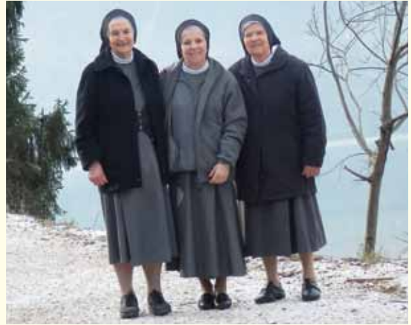
Communauté de Vittorio Veneto (TV)

C'a été beau verser dans Son cœur maternel un peu de nos joies et souffrances sentant que le chemin vers Dieu est fatigant pour nous toutes ; parcourant à nouveau nos activités à l'étranger, nous avons pu respirer la vie de notre Congrégation en terre de mission et nous sentir partie d'une unique et grande Famille.