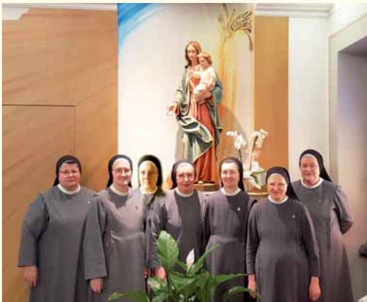
la communauté de Trévis, quelques sœurs sortent pour visiter les malades dans les maisons d'autres personnes